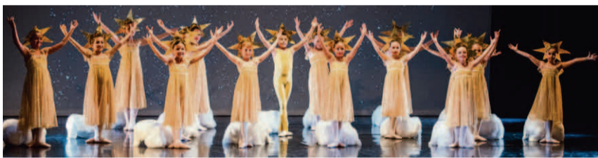
Sehr herzlich: Gut choreografierter Sternli-Tanz der kleineren Schülerinnen und Schüler.